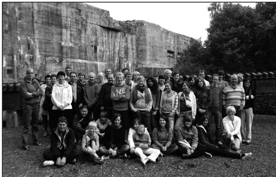
Tekst: Dajo Huylebroeck